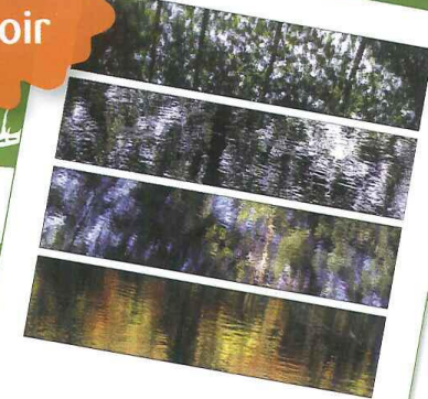
Impressionnismes Agnès Brossat